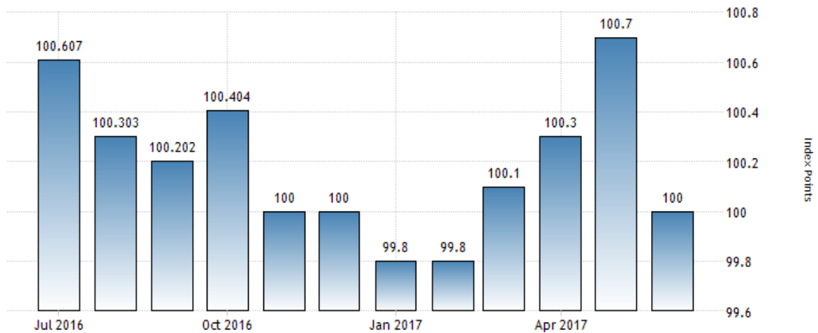
ISRAEL CONSUMER PRICE INDEX (CPI)