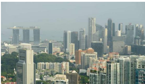
ย่านธุรกิจ Marina Bay ของสิงคโปร์

URA รายงานว่า ราคาพื้นที่สำนักงานให้เช่ามีอัตราลดลง 0.4% ในไตรมาสที่ 3 ปี 2559 เมื่อเทียบกับไตรมาสที่ 2 ปี 2559 ที่ลดลงถึง 1.5% โดยตั้งข้อสังเกตถึงพื้นที่สำนักงานให้เช่ามีพื้นที่ลดลง 5,000 ตารางเมตร ในไตรมาสที่สาม ปี 2559 เมื่อเทียบกับไตรมาสที่ 2 ที่มีพื้นที่เพิ่มขึ้น 30,000 ตารางเมตร