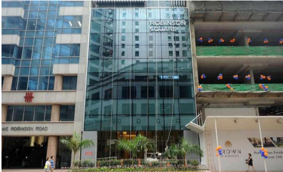
อาคารสำนักงาน Robinson Square ในย่านธุรกิจของสิงคโปร์