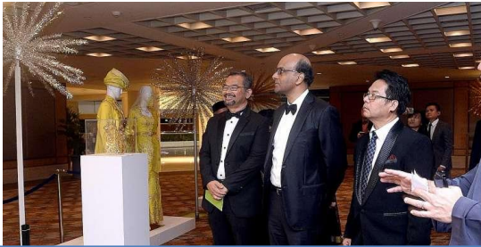
Mr. Tharman Shanmugaratnam รองนายกรัฐมนตรี (คนกลาง) ในพิธีเปิดงานฯ

(SMCCI) ได้จัดงานกาล่าดินเนอร์เพื่อการกุศลเฉลิมฉลองครบรอบ 60 ปีของการก่อตั้ง SMCCI ซึ่งได้รับเกียรติจาก