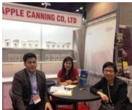
V&K Pineapple Co., Ltd.