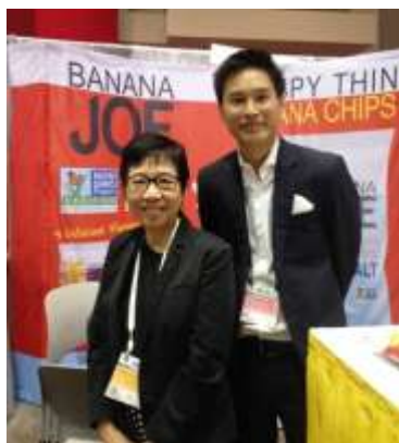
Opimus Co., Ltd (SME Pro-active)

มีผู้ผลิต/ส่งออกไทยไปเข้าร่วมงานเอง 4 ราย และเป็นผู้ส่งออกที่ได้รับการสนับสนุนภายใต้โครงการ SME Pro-active 1 ราย คือ บริษัท OPIMUS Co., Ltd. นำสินค้ากล้วยทอดกรอบไปจัดแสดง และ อีก 3 ราย คือ บริษัท V&K Pineapple สินค้าผลไม้อบแห้ง บริษัท Lily Tobeka Co., Ltd. สินค้าถั่วอบชนิดต่างๆ และ บริษัท Towne Corporation สินค้าผลไม้แบบ Freeze Dried