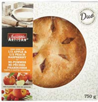
ผลิตภัณฑ์ Par-Baked Artisan deep dish pie