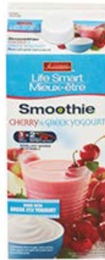
ผลิตภัณฑ์ Life-Smart Smoothie