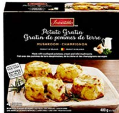
ผลิตภัณฑ์ Potato Gratin