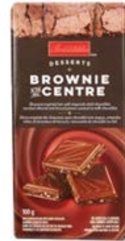
ผลิตภัณฑ์ Brownie in the Centre