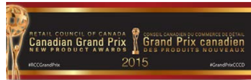
Canadian Grand Prix New Product Awards

เมื่อวันที่ 1 มิถุนายน 2559 คณะกรรมการงาน Canadian Grand Prix New Product Awards ได้ประกาศผลผู้ชนะเลิศรางวัลสินค้าใหม่ในงาน Canadian Grand Prix New Product Awards ครั้งที่ 23 ที่ Retail Council of Canada Gala ซึ่งงาน Canadian Grand Prix New Product Awards นี้เป็นงานที่จัดขึ้นทุกปี โดยมีวัตถุประสงค์เพื่อส่งเสริมการพัฒนาสินค้าใหม่และนวัตกรรม ซึ่งมีความสำคัญอย่างมากในการเติบโตอย่างต่อเนื่อง ของอุตสาหกรรมการผลิตสินค้าสำหรับผู้บริโภคในประเทศแคนาดา ทั้งนี้ยังเป็นการเปิดโอกาสให้ผู้เข้าแข่งขันแสดงสินค้าใหม่ของตนแก่คณะกรรมการตัดสินการแข่งขันของผู้เชี่ยวชาญทางอุตสาหกรรมประเภทต่างๆ และเป็นที่ยึดใจของบรรดาผู้เข้าแข่งขันด้วยกัน ซึ่งในรายการแข่งขัน Canadian Grand Prix New Product Awards ครั้งนี้ ได้มีการแบ่งประเภทการแข่งขันออกเป็นหมวดหมู่ต่างๆ อันได้แก่ Food, Non-Food, Private-Label Food และ Private-Label Non-Food