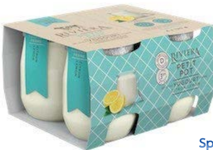
ผลิตภัณฑ์ Riviera Petit Pot Set-Style Yogurt