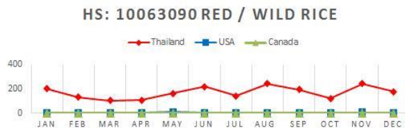
Thailand V.S. Top 3 Competitors by Quantity : KG Thousand (000)

แม้ว่าจะยังไม่มีมีการแยกสถิติการนำเข้าข้าวไรซ์เบอร์รี่โดยเฉพาะ แต่ตลาดข้าวสุขภาพ/ข้าวออแกนิกในฮ่องกงเติบโตอย่างต่อเนื่องในช่วง 3 ปีที่ผ่านมาทั้งด้านปริมาณและมูลค่า ในปี 2558 ฮ่องกงนำเข้าข้าวประเภทดังกล่าวรวมทั้งสิ้น 2,215 ตัน เพิ่มขึ้นจากปี 2557 ที่นำเข้า 1,985 ตันหรือเพิ่มขึ้นร้อยละ 11.7 โดยไทยเป็นผู้ส่งออกรายใหญ่ครองส่วนแบ่งตลาดมากกว่าร้อยละ 92.2 ในขณะที่สหรัฐอเมริกาและแคนาดาเป็นอันดับ 2 และ 3