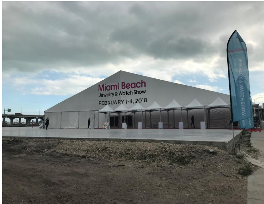
สถานที่จัดงาน เป็นการกางเต็นท์ชั่วคราว