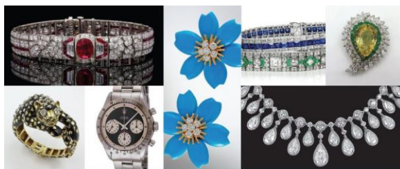
สินค้าที่จัดแสดง