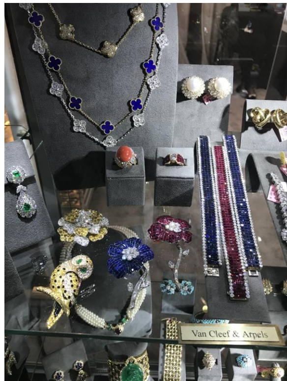
เครื่องประดับเก๋ๆ ห้อย Van Cleef & Arpels